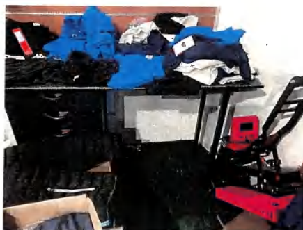
1 bureau de ministre en bois laqué noir