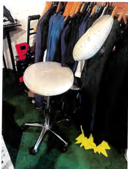
1 fauteuil de bureau en skaï blanc (usagé)