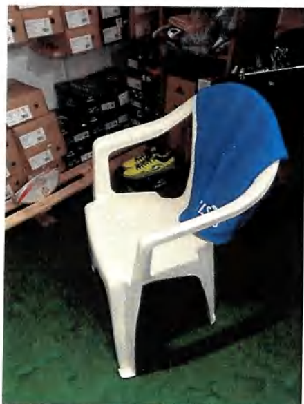
1 fauteuil en pvc blanc